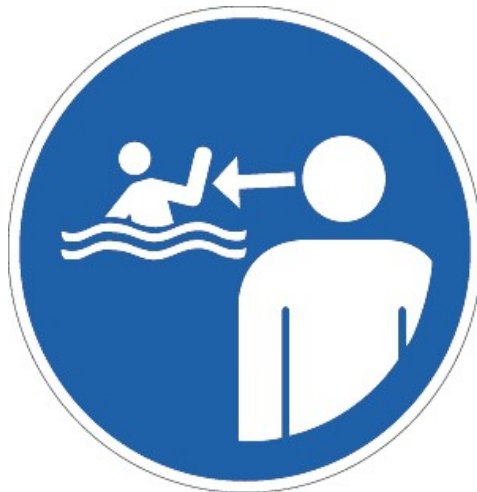
Sicherheitszeichen ISO 20712-1 – WSM002 „Kinder im Wasser und der Wasserumgebung stets beaufsichtigen“

Sie sollen in einem Abstand von höchstens 2 Metern an einer gut sichtbaren Stelle angebracht werden.